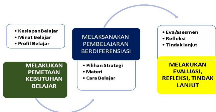
Gambar 1. Tahapan pembelajaran berdiferensiasi